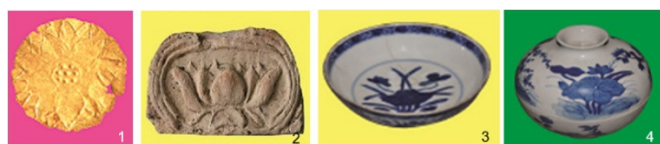
Hình 3. (1) Hiện vật vàng Óc Eo hình hoa sen; (2) Diềm ngói gốm trang trí hoa sen; (3) Đĩa trang trí hoa sen; (4) Thổ trang trí hoa sen (nguồn: [1])

Tháng 3/2018, Bảo tàng Đồng Tháp cũng tổ chức trưng bày gần 50 hiện vật "Hình tượng hoa sen trên cổ vật" tại TP. Hồ Chí Minh (hình 3) [1].