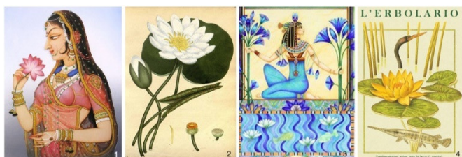
Hình 4. (1) Sen hồng Ấn Độ; (2-3) Sen trắng và xanh Ai Cập; (4) Sen vàng Mỹ

Trên thế giới, sen có mặt trong văn hóa từ Đông sang Tây. Theo màu sắc, hoa sen có 4 loại (hình 4): Sen hồng ở Ấn Độ, sen trắng và xanh ở Ai Cập, sen vàng ở Mỹ [15]. Hoa sen mọc ở Đồng Tháp và Việt Nam thuộc loại sen hồng Ấn Độ.