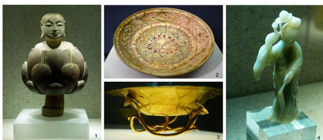
Hình 2. (1) Tượng Phật Thích Ca sinh từ hoa sen, gỗ sơn thế kỷ XVII; (2) Đĩa trang trí hoa sen thế kỷ XV, Cù Lao Chàm; (3) Chậu hình lá sen, vàng thế kỷ XIX; (4) Tượng tiên nữ cầm hoa sen, ngọc, thế kỷ XIX (nguồn: [2])

cổ vật" giới thiệu hơn 100 cổ vật quý tiêu biểu làm từ nhiều chất liệu (đất, gỗ, giấy, ngọc, vàng, bạc...) có họa tiết hoa sen với niên đại từ thời Lý đến thời Nguyễn [2]. Thời Lý (thế kỷ XI-XIII) có những viên gạch lát nền, viên ngói làm bằng đất nung in nổi hình hoa sen. Thời Lê, thời Nguyễn có các pho tượng Phật Thích Ca sinh ra từ hoa sen, tượng Bồ Tát ngồi trên tòa sen, lư hương trang trí hình rồng châu sen, mũ trang trí cánh sen của văn hoá Chăm-pa... làm bằng gỗ sơn, bằng sành, bằng đồng, bằng vàng... có rất nhiều đồ ngự dụng như hộp, chậu, nghiền mực, chân đèn, chân nến, ấm chén, bát đĩa, bình, đỉnh... được chế tác từ những chất liệu quý hiếm như ngọc, vàng, bạc, ngà... với hình hoa sen, khóm sen, cây sen, đài sen... được khắc họa hết sức mềm mại, tinh xảo, sống động, tạo nên vẻ đẹp thanh thoát, tao nhã, quý phái (hình 2).