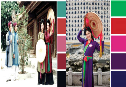
Hình 7. Màu sắc trang phục nữ Quan họ xưa và nay

Cùng với thời gian, với sự biến đổi chung của thời đại, bảng màu của y phục nói chung và của người Quan họ nói riêng cũng có những thay đổi. Nhìn chung, ngoài hai màu chính, mà phần lớn là những màu đậm, thuộc sắc âm: đen (thâm) và nâu gụ, càng ngày màu sắc trang phục càng tươi sáng và nhiều màu sắc hơn. Đặc trưng cơ bản trong màu sắc của trang phục Quan họ là gam ấm, giản dị. Tuy nhiên, càng ngày do yếu tố rộng mở và lan tỏa của văn hóa Quan họ, Quan họ xuất hiện nhiều trên cả các sân khấu lớn do vậy mà cả về màu sắc và kỹ thuật cắt may của trang phục đều đẹp hơn, phong phú hơn trên cái nền dáng dấp cơ bản truyền thống (hình 7).