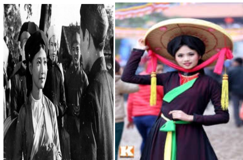
Hình 6. So sánh cải tiến trang phục nữ Quan họ xưa và nay

duyên dáng khiến trang phục Quan họ mang một màu sắc riêng. Dù chỉ còn hai lớp nhưng khi nhìn vào người ta vẫn cảm thấy như là ba lớp vì các lớp vải được sắp xếp chồng lên nhau một cách hết sức hài hòa và khéo léo. Thực ra miếng lá lật của các bà, các cụ ngày xưa được cách tân nhỏ gọn hơn. Khi mặc trang phục Quan họ mà không có lá lật hay yếm đào thì coi như chưa thành bộ. Chiếc Yếm ban đầu chỉ được may đơn giản nhưng về sau đính thêm các hạt kim xa, kim tuyến quanh vòng cổ để tạo nên vẻ lung linh, lấp lánh cho người mặc khi biểu diễn trên sân khấu vào ban đêm (hình 6)