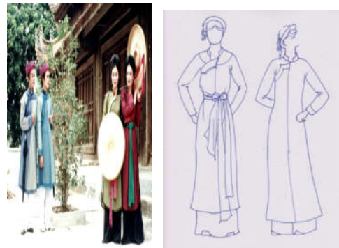
Hình 5. Nghiên cứu đường nét Áo dài Quan họ [7]

Trang phục trở nên lịch lãm bởi sự kết hợp của các đường chéo trên cổ, hình của yếm, của đường bề vạt con như một sự gợi mở đi lên một sự tưởng tượng chưa kết thúc, là nút hững hờ xống xính giao tình đung đưa theo nhịp của làn điệu Quan họ. Các nếp buông rủ, buộc thắt của đường nét thắt lưng như nhấn thêm sự sự dịu dàng, ý tứ là sinh động theo mỗi bước đi của liên chị Quan họ. Nét phẩy của lọn tóc đuôi gà hoặc nét của vành khăn mỏ quạ làm gương mặt của liên chị sinh động và yêu kiều (hình 5).