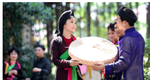
Hình 1. Trang phục liên anh liên chị hát Quan họ

Dân ca Quan họ là hình thức hát giao duyên, tồn tại trong một môi trường văn hóa với những tập quán xã hội đặc thù. Hội Quan họ diễn ra ở trong nhà, trên sân đình, trước cửa chùa hay bồng bênh trên những thuyền thúng giữa ao, hồ (hình 1). Dân ca Quan họ một nét đẹp văn hóa Việt với những làn điệu dân ca mượt mà sâu lắng đã đi vào lịch sử. Cùng với nét thơ, lời ca ấy là những bộ trang phục Quan họ với vẻ đẹp đậm đà khó quên. Năm 2009, Dân ca Quan họ đã được UNESCO công nhận là Di sản văn hóa phi vật thể đại diện của nhân loại.