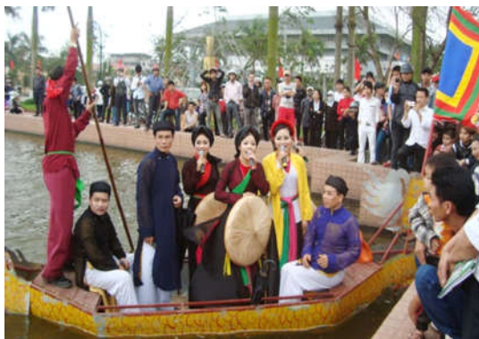
Hình 8. Trang phục Áo dài Quan họ ngày nay

Ngày xưa, chất liệu tạo nên nét thanh tao của trang phục Quan họ chủ yếu may bằng the, lụa tơ tằm. Lụa Vạn Phúc Hà Đông là loại lụa được dệt nên từ chất liệu tơ tằm tự nhiên, mang nét mềm mại, mịn óng, tinh tế, đạt đến độ hoàn mỹ, mát mẻ vào mùa hè, ấm áp vào mùa đông. Hoa văn bao giờ cũng trang trí đối xứng, đường nét trang trí không rườm rà, phóng khoáng, dứt khoát, với nhiều gam màu nhẹ nhàng, hoặc rực rỡ, đường nét hoa văn tinh tế, hấp dẫn. Các sản phẩm của làng lụa Vạn Phúc đa dạng về màu sắc, phong phú về chủng loại và có tiếng là bền và đẹp. Váy may bằng vải Lĩnh tía hoặc sa tanh đen, khăn