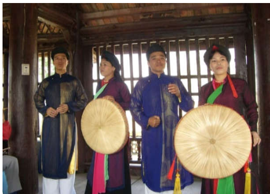
Hình 2. Trang phục Nam - Liễn anh

• Trang phục Nam - Liễn anh [4]: Các thành phần trang phục liễn anh Quan họ vào giai đoạn từ đầu đến gần cuối thế kỷ XX, bao gồm: Áo dài năm thân, áo cánh, quần, thắt lưng, khăn lượt, giày Gia Định, ô đen (hình 2).