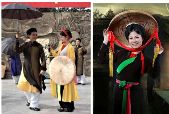
Hình 3. Trang phục Nữ - Liễn chị (Áo dài tứ thân (trái); Áo dài ngũ thân (phải))

• Trang phục Nữ - Liễn chị [4]: Các thành phần trang phục Quan họ nữ vào giai đoạn gần cuối thế kỷ XX, bao gồm: Áo dài tứ thân, Áo dài năm thân, áo cánh, yếm, váy; phụ trang: Thắt lưng, khăn bọc tóc, khăn vuông (khăn mỏ quạ), nón quai thao, dép cong (hình 3).